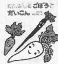
「にんじんとごぼうとだいこん」 日本民話 和歌山静子/絵 すずき出版

にんじんが赤いのはなぜ？ごぼうが黒いのはなぜ？だいこんが白いのはなぜ？ そんな疑問にゆいにかわいく答えてくれている日本民話です。 目鼻や口のついたにんじん、ごぼう、だいこんの表情や動きがおもしろく、今にも話しかけてくるような気がします。 さて、疑問の答えは…みんなでお風呂をわかつて入ったのですよ。