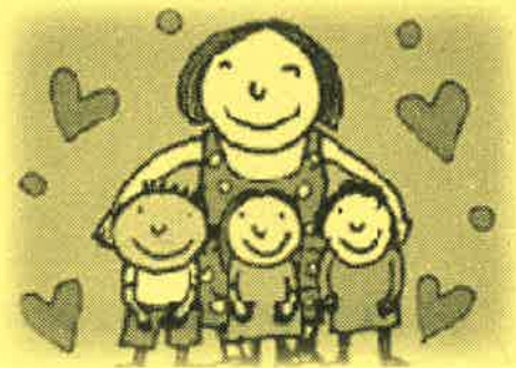
『日本ユニセフ協会ホームページ』