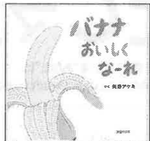
作:矢野アケミ 大日本図書

8月初めに、子ども2人と絵本の日に参加しました。夏休み中の小学生、小さな赤ちゃんと初めて参加のお母さん、お孫さんと一緒に来た人など、大人6人、子ども12人が集まり、この日は6冊の本が紹介されました。