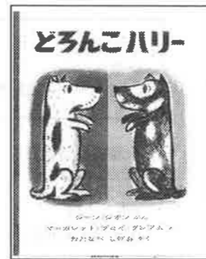
ジーン・ジオン/文 マーガレット・ブロー・グレアム/絵 わたなべしげお/訳 福音館書店

ハリーは、お風呂が大嫌い。ある日家を抜け出し泥だらけになって遊ぶハリー。石炭トラックのすべり台で遊んでだんだん真っ黒に汚れていくそんな生き生きと楽しそうに遊ぶハリーに、こどもたちはドキドキ、ワクワクすることでしょう。「しろいぶちのあるくろいぬ」になってしまったハリー。家へ帰ってお風呂でゴシゴシ洗ってもらって「くろいぶちのあるしろいぬ」に戻りました。お風呂いやじゃなくなったのかな? (tani)