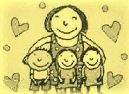
『日本ユニセフ協会ホームページ』