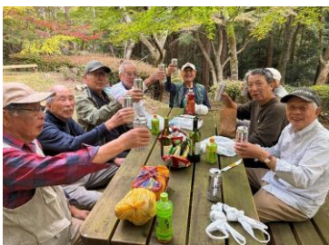
缶入り「泡般若水(ビール)」で乾杯