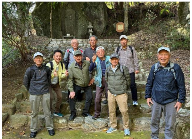
公園入口の地蔵菩薩立像の前の「生き地蔵の面々」