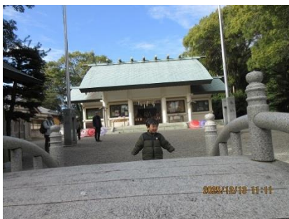
彌都加伎神社の社殿

初詣のコースを打ち合わせや情報の交換などして楽しい時間を過ごし、来年も頑張りましょうとのあいさつで今年の締めくくりとなる。