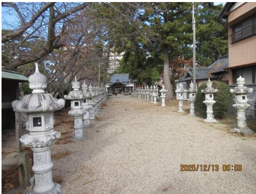
勝速日神社の参道

今年一番の冷え込みを感じる朝であったが日が上がるにつれて風もなく、絶好のウォーキング日和となった。近鉄白子駅東口に集合。駅のすぐ傍に『勝速日神社』が祀られている。この神社は鈴鹿サーキットで行われる8耐などのレーサーが勝利と安全を願って参拝をすることで知られている。我々も今日の安全を願ってお参りした。